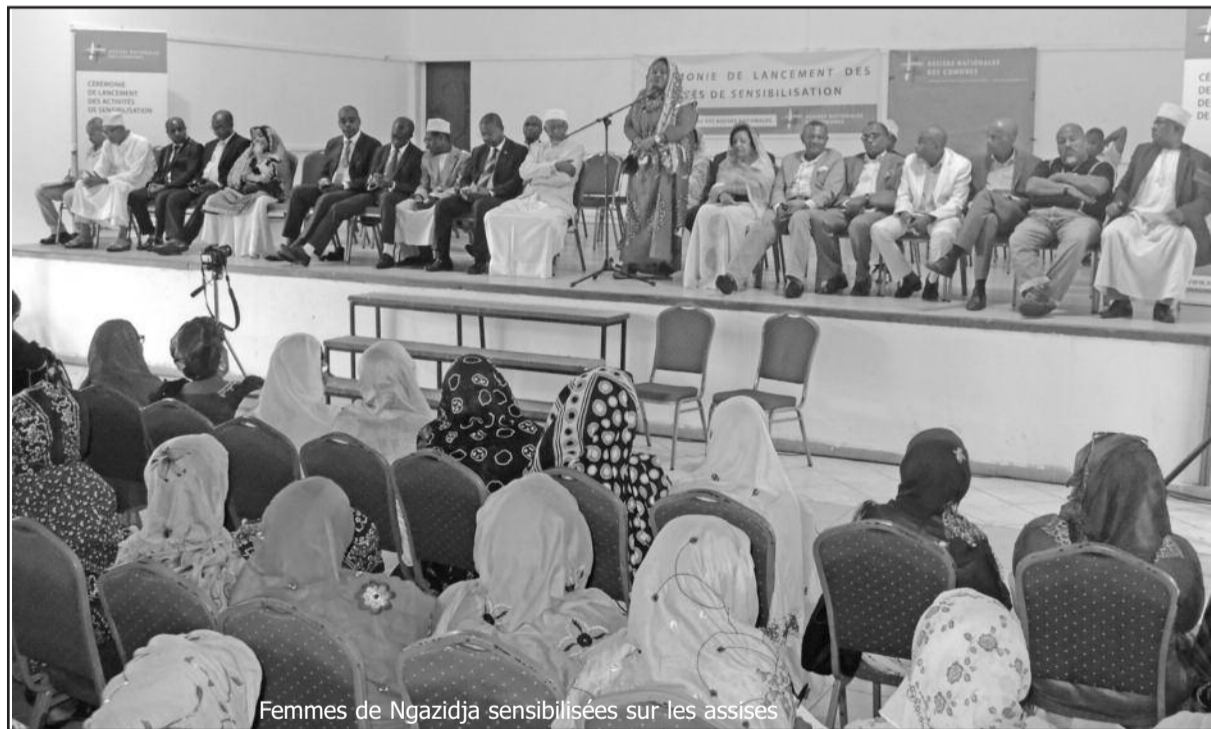
Femmes de Ngazidja sensibilisées sur les assises